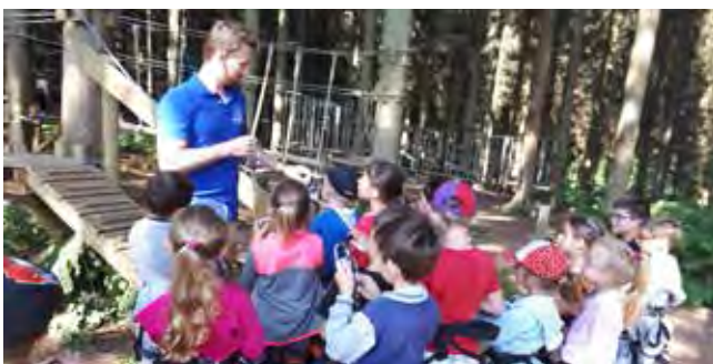
Préparation pour l'accrobranche (primaire Étrépagny)

Le Bois des Aigles - Cerza - Musée de la vie agricole de l'oise - Village des sports (Evreux) - Tonysland - Ferme de Poly - Poney club - Accrobranche - Base de loisirs de Brionne - Zoo d'Amiens - Honfleur - Dieppe - Parc St Paul - Bocasse - Biotropica - Bowling et Laser game - Inter centre et barbecue géant à Mainneville - Parc à Rouen - Les Andelys et toutes les semaines piscine, ludo-médiathèque.