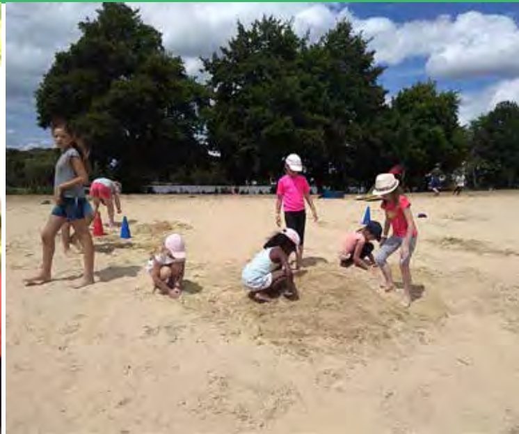
Base de loisirs de Brionne (primaire Étrépagny)