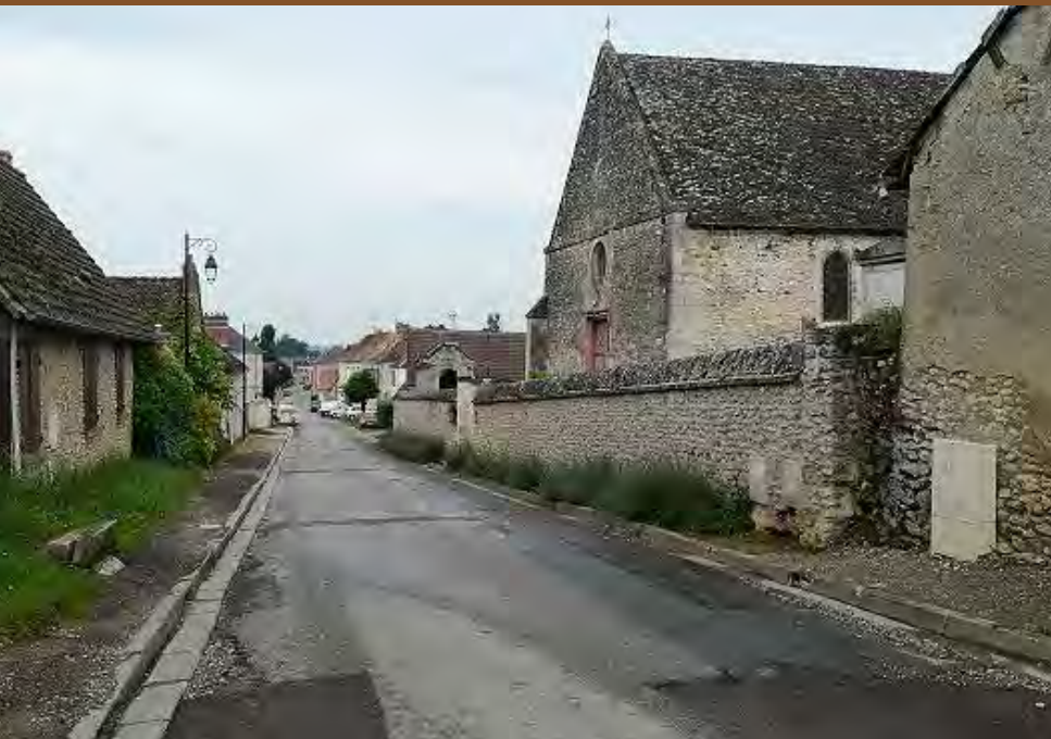
Vesly, rue de l'église avant travaux et vue d'en haut de la rue