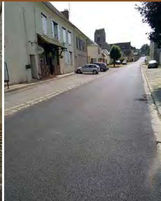
Vesly, rue de l'église après travaux et vue d'en bas de la rue